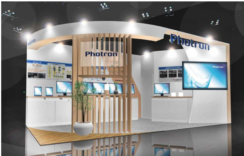
ブースイメージ【コマ番号 展示ホール B 042】